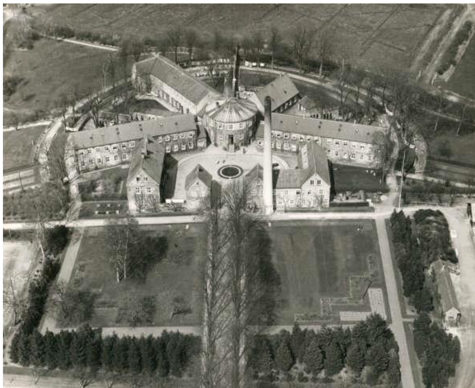
Anstalten fra ca. 1910. Inspektørbolig og administration i centrum.