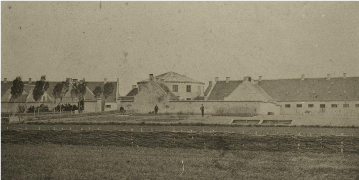
Anstalten. Foto fra omkring 1880.