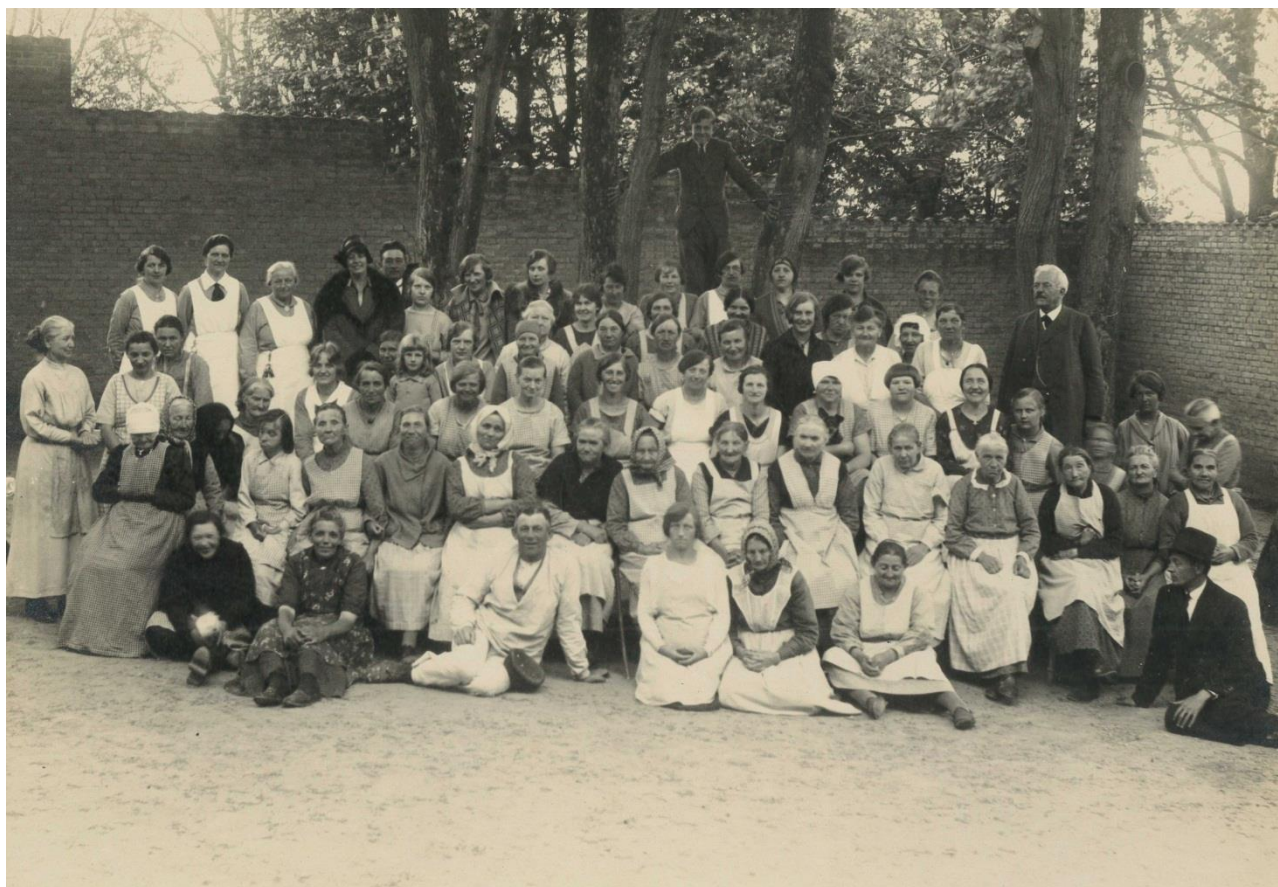
Kvindeafdelingen og personale samt inspektøren Foto udateret, men fra før 1892.