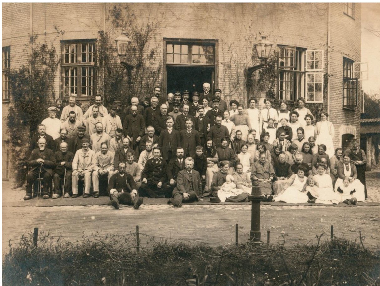
Opstilling ved Runddelen. Udateret foto fra Anstalten.